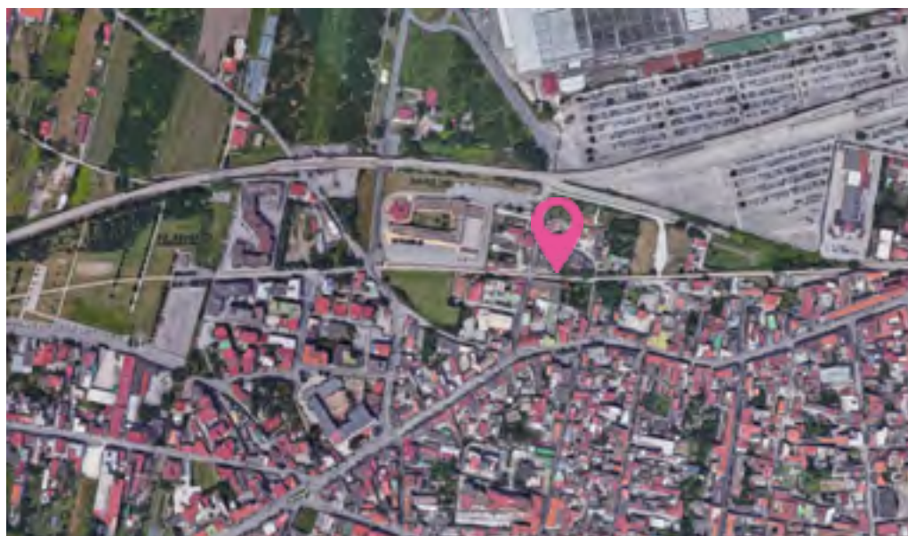
Presidio Ospedaliero Via Felice Pirozzi, 20